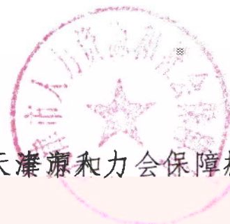
天津市人力资源和社会保障局