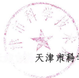
天津市科学技术局