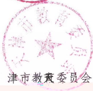
天津市教育委员会